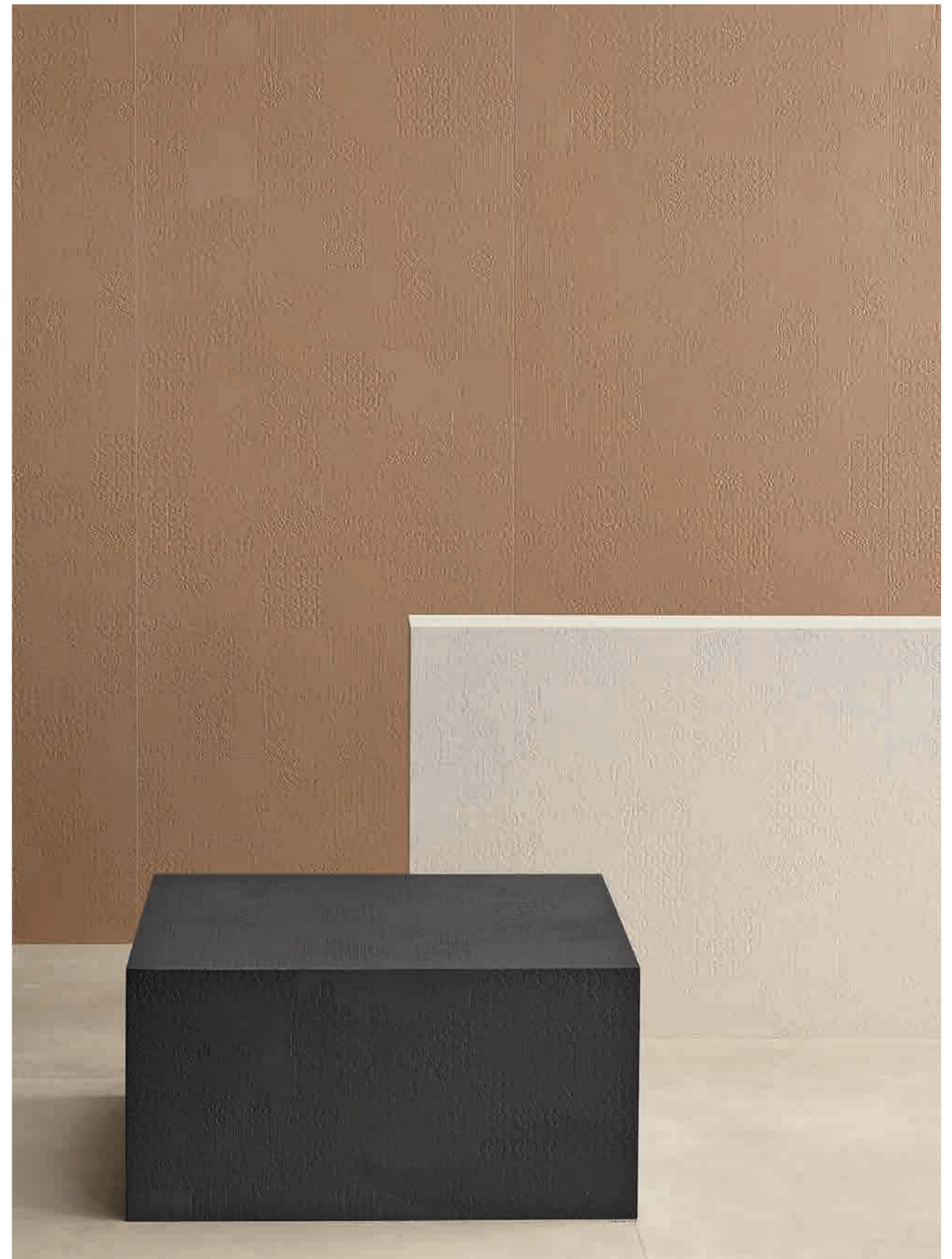
This page: Avana, Gesso, Grafite. Opposite page: Gesso.